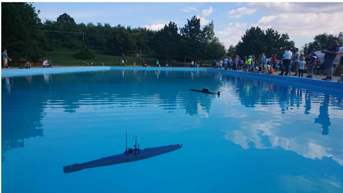
Miesto stretnutia - areál letného kúpaliska Bratislava – Rača